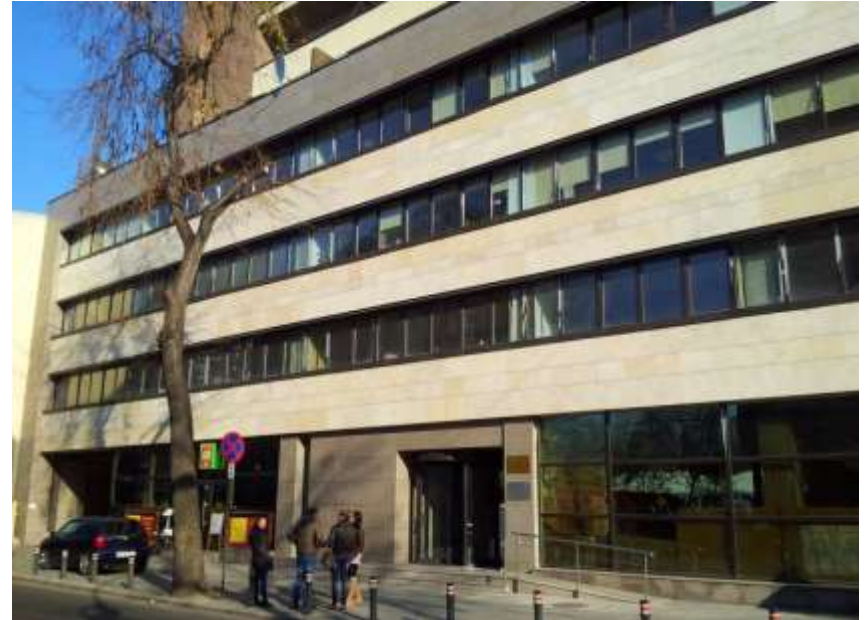
Mihai Eminescu nr. 163, Sector 2, București